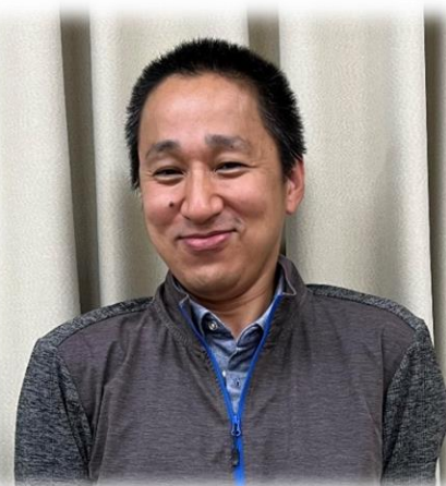
代表近影 2023.6.7 運営委員会会場にて